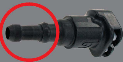
L'embout Arrondi 'Posi-Hold'

Raccords satisfaisant ou excédant le calibre de 200 lb/po 2 du tube de nylon 12 lorsqu'utilisé avec la grosseur de tube appropriée et brides de 360°